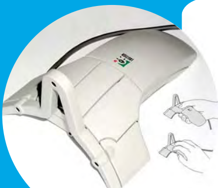
Logitech 3D Mouse