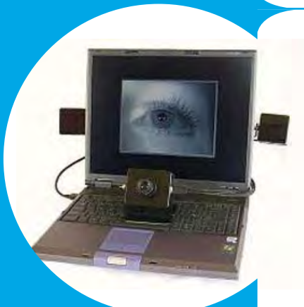
EyeTech Digital Sys